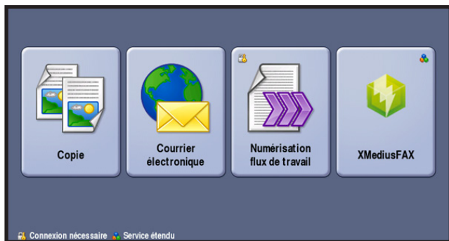
Figure 3 : Écran de sélection du service