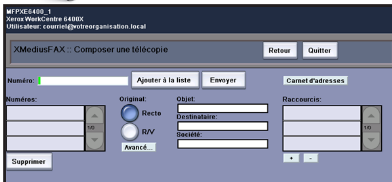
Figure 4 : Écran de saisie des coordonnées du destinataire du fax