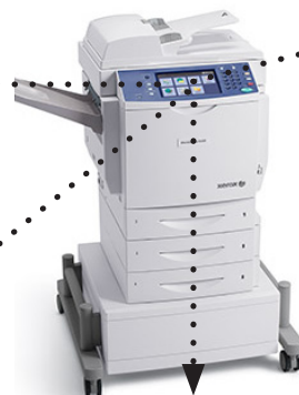
Figure 1 : MFD WorkCentre 6400 de Xerox

Le panneau de commande du MFD fournit l'accès aux riches caractéristiques de la solution de serveur de fax XMediusFAX ou OpenLine